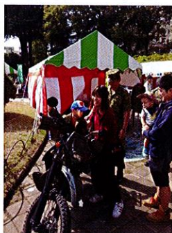
偵察用オートバイに乗って決めポーズ