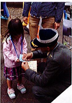
「キタちゃん」シールを張ってもらいご満悦