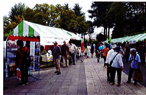
初日は午後から天気にも恵まれ、幅広い年齢層の来場者で盛り上がった。

東京地本北地域事務所は、平成29年10月7日及び8日の2日間、東京都北区赤羽会場（赤羽公園）において開催された「ふるさと北区区民まつり」で広報ブースを出展した。 ふるさと北区区民まつりは、区内産業と文化の振興及びふるさと北区の実現を目指して昭和59年から毎年秋に3会場（赤羽、王子、滝野川）で開催されており、今年で34回目の開催となる。この区民まつりは多数のボランティアで運営され、子供からお年寄りまで楽しめる地域に根差した北区最大級のイベントとして親しまれており、例年約20万人規模の来場者数を誇っている。 広報ブースでは、災害派遣活動状況等のパネル展示や制服の試着コーナーを行うとともに、第1普通科連隊第2中隊（練馬）の支援を受けて、偵察用オートバイの展示を行った。 中でも、迷彩服を試着してオートバイにまたがり記念撮影をする体験型コーナーが人気で、順番待ちの列が出来るほどであった。 また、体験型コーナーの待ち時間に幼児達を飽きさせないために、「北ちゃん（北区のマスコット）」シールを貼ってあげるサービスが親子連れに人気で、盛会の一助となっていた。 さらに、災害派遣活動状況等の写真パネルや説明文を興味深く見る人や、自衛隊説明ブースにおいて幅広い年齢層の方から活動内容や自衛官採用に関する質問が多く寄せられる等、充実した2日間となった。 東京地本北地域事務所は、今後も地域と自衛隊の架け橋として、こうした地域イベントに積極的に参加し、地域の方々の信頼を獲得していくとしている。