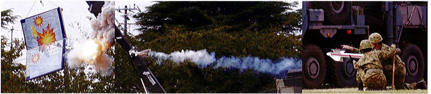
【訓練展示】・・・場内に、“只今空自より、敵機接近の情報を入手、レーダーがキャッチした！”との放送があり、その情報を下に、写真上は、「03式対空中距離誘導弾」発射を想定した模擬射撃の様子です。写真下は右から、射撃用レーダー装置搭載車両、レーダー信号処理・電源車、発射装置搭載車両です。写真では、その迫力を実感出来ませんが、模擬とはいえ、是非一度、その迫力ある訓練展示を体験してほしいものです。