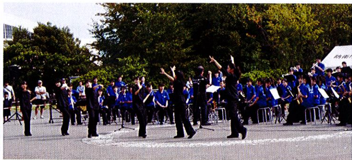
◇写真上：応援に駆け付けてくれた「松戸市立・第4中学校吹奏学部」のファンシードリルと演奏風景。中学生とは思えぬ演奏に、拍手喝さいでした。