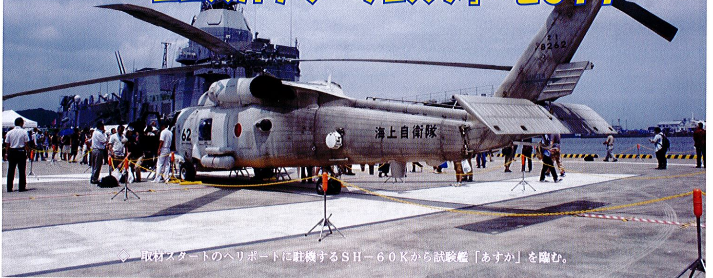
◇取材スタートのヘリポートに駐機するSH-60Kから試験艦「あすか」を臨む。