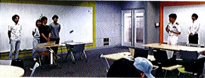
本部長からの質問に答える学生たち