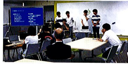
本部長（右端）を前に研究成果を披露する学生たち

神奈川地本は、「今回の学生の発表内容を更に分析、部隊研修をとおして、神奈川地本としてより良い募集広報実施につなげていくことのできる成果を得たい」としている。