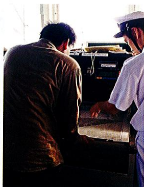
「はしだて」乗組員に海図について質問する参加者