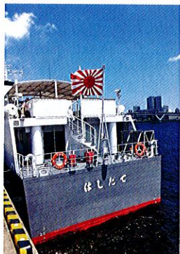
出港前の「はしだて」

市ヶ尾募集案内所は「海上自衛官を目指す参加者たちにとって、はしだての航海は大変貴重な時間となった。今後も体験航海の機会を積極的に活用し、海上自衛隊の魅力伝えていきたい」としている。