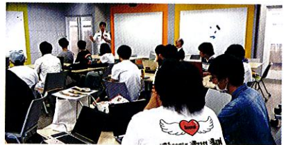
学生たちを前に今後も研究に期待する旨を伝える本部長